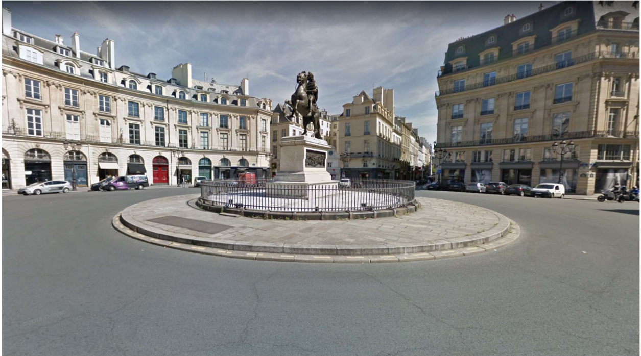
Place des Victoires, Paris