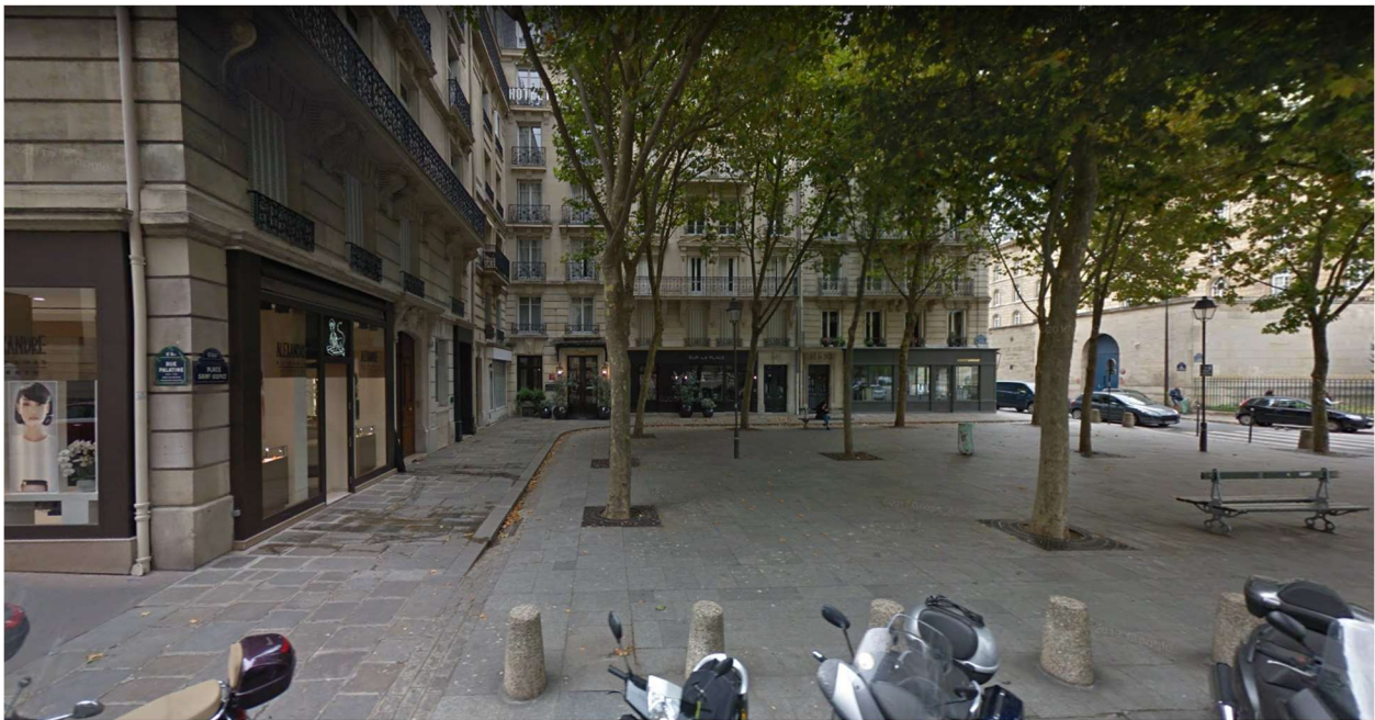
Rue Palatine, Paris